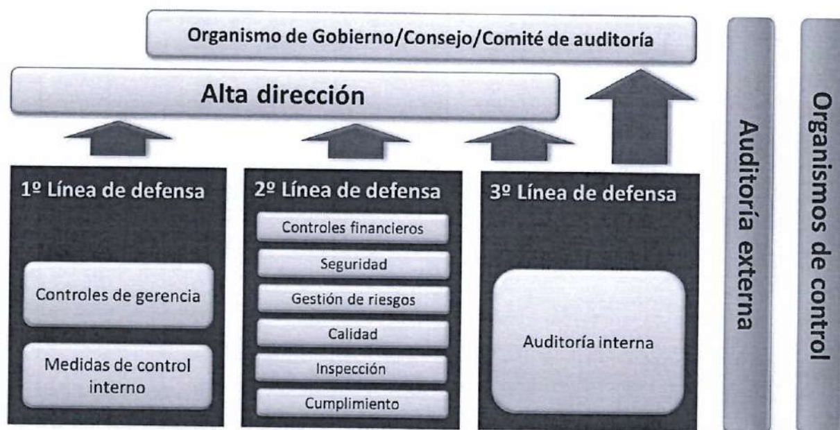
Ilustración 3: Modelo de las 3 Líneas de defensa

El Modelo de Gestión del Riesgo de la Universidad se apoya en un esquema de tres líneas de seguridad, que asegura una gestión integral, clara y responsable: