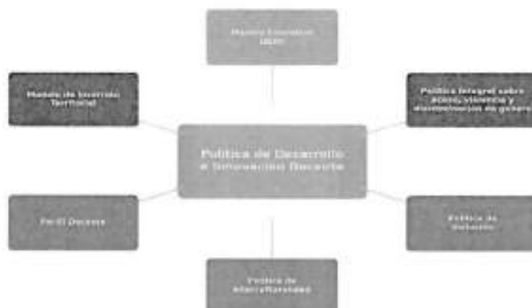
Fig. 1: Fundamentos institucionales de la Política de Desarrollo e Innovación Docente

Para responder a los desafíos que propone la sociedad contemporánea en todos los niveles académicos, desde el pregrado hasta los programas de posgrado, es esencial contar con un cuerpo académico altamente calificado, que se distinga no solo por su competencia disciplinaria, sino también por su compromiso con los principios fundamentales que rigen la UAcademia y por su concordancia con la concepción institucional del proceso de enseñanza-aprendizaje. Por consiguiente, la Política de Desarrollo e Innovación Docente se implementa a través del Centro de Desarrollo e Innovación en Docencia (CeDID) , unidad que forma parte de la Dirección de Desarrollo Académico (DIDA), dependiente de la Vicerrectoría Académica (VRA). El CeDID formaliza y articula funciones que antes operaban de manera dispersa, y asume la conducción integral de la política, organizando su quehacer en tres áreas: Docencia y Trayectoria; Formación; e Investigación e Innovación en Docencia.