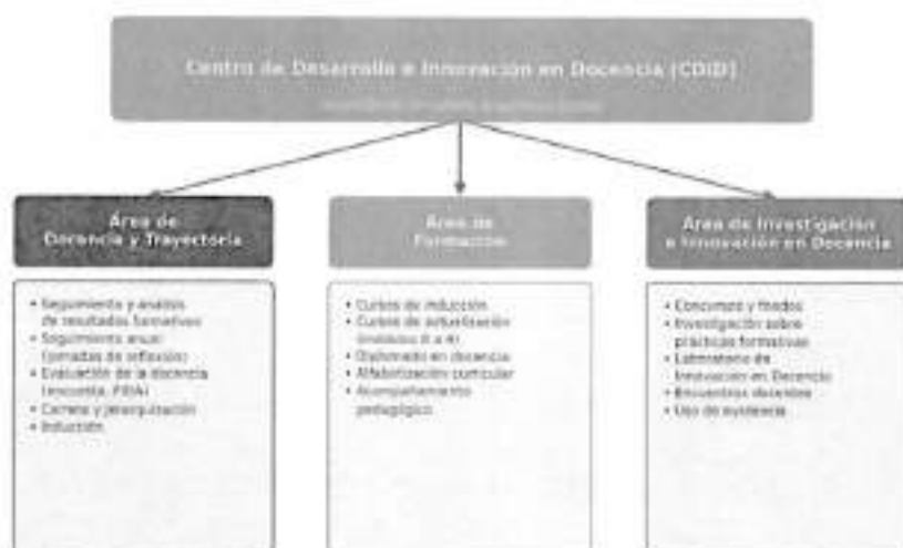
Fig. 2: Centro de Desarrollo e Innovación en Docencia y sus tres áreas

La conducción del sistema corresponde al Centro de Desarrollo e Innovación en Docencia (CeDID) , unidad de la Dirección de Desarrollo Académico, que organiza su quehacer en tres áreas articuladas entre sí: (i) Docencia y Trayectoria; (ii) Formación; y (iii) Investigación e Innovación en Docencia. A continuación, se describe el propósito y los componentes de cada una: